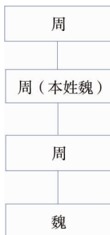
图3 “过继养老”类型图例

欧阳的父亲是洪家过继到欧阳家里来为欧阳家的老人养老的,因为洪家与欧阳家是世代的老邻居,欧阳家因女主人一直不生育,二老近五十岁,膝下没儿女,他的爷爷就将他父亲过继到欧阳家,为老人养老送终。那时他的父亲已经二十几岁,过来后直接改姓欧阳,他也就相应地跟着父亲改姓欧阳了。等到他的儿子这一辈就要还宗了,而且洪姓家族也很希望他们还宗,并在家谱的记录中也留下了他父亲及其后人的位置。当我问到,在上户口方面会不会遇到麻烦,他说这都没啥问题,他们在村委会开具证明,到乡政府盖章,再到派出所的户籍室就可以办理改名或者户口登记了。现在到他的孩子这一辈已经是第三代人了,就改姓洪了。