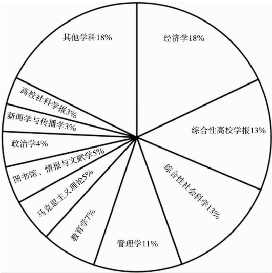
图 2 习近平关于科技创新重要论述的研究来源期刊学科分布情况

首先,从期刊来源看,样本文献涉及期刊 424 种,其中载文量在 10 篇及以上的期刊共 81 种。根据 CSSCI 对期刊的学科分类,期刊学科分布的总体情况如图 2,载文量居前 15 位的期刊见表 2。