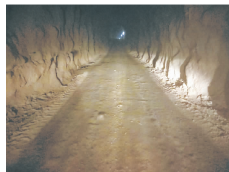
图 3 抑尘剂施工 20 d 且补水 24 h 后效果

通过对第一次实验性总结发现,抑尘剂喷洒数量偏少;空气湿度较为干燥,相对湿度约为 25%,可以在关键进风口选择合适位置加装喷雾装置,增加空气湿度;巷道两侧根部未能喷洒到位;抑尘剂适当调整配方,将吸收空气水分相对湿度调整为 25%,通过上述措施可以进一步提升抑尘剂的效果.