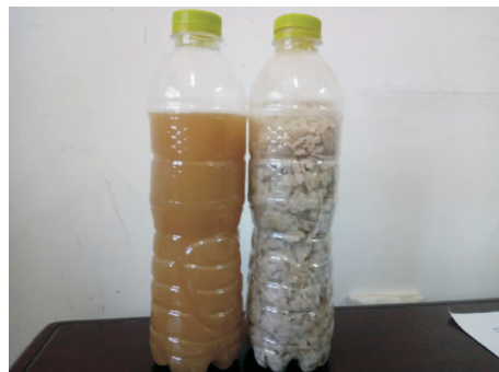
图 2 路面型抑尘剂融水后效果

该矿一次性购置了 5 t 路面型抑尘剂,对 6 400 m 长度合计 25\ 600 \text{ m}^2 的斜坡道路面进行喷洒,喷洒宽度约为 4 m,斜坡道宽度为 5 m,每平方米喷洒量为 0.97 kg,使用后 3 d 内路面湿润度理想,但 3 d 后路面开始干燥,决定每天用洒水车补充 1 遍水分,20 d 后对斜坡道补水 24 h 后进行观测,车辆行驶后经测定全尘含量约为 10 \text{ mg/m}^3 ,现场效果见图 3,原有洒水后 20 h 测定全尘含量约为 48 \text{ mg/m}^3 ,通过数据对比应该说具有显著的效果,且保湿时间延长后,洒水次数也在大幅降低,原有每天洒水 2 次,2 个作业班,现为 1 个作业班即可,连续观测 60 d 后效果降低显著,有效期约为 45 ~ 60 d.经济效益对比见表 2.