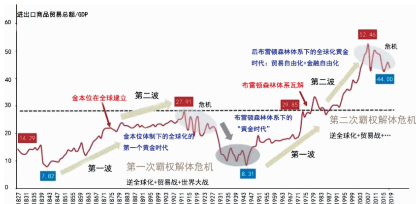
图 1 全球经济出现过两次“去中心化”现象